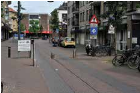
De toegang in de Brammelerstraat