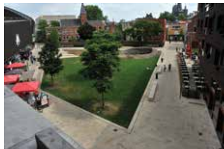
Wilminkplein van boven