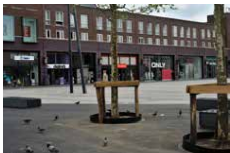
Nieuwbouw van de Klanderij in 2001

Zoals al eerder gezegd komt de SWBE, de wijkraad, voort uit de BvB, Belangenvereniging van Binnenstadbewoners. Toen de BvB in 2001 ontstond was de ontwikkeling naar een "nieuw" Enschede al in volle gang.