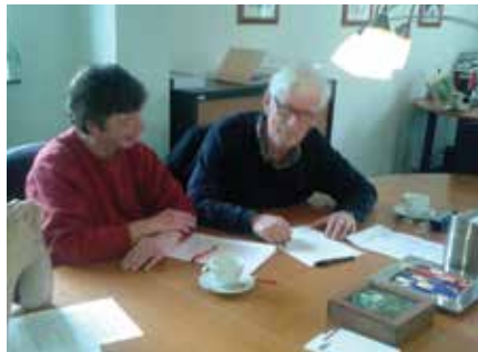
Ondertekening van de Stichtingsakte

Het werkgebied van de Wijkraad Binnenstad ligt binnen de ring Hengelosestraat, Molenstraat, Oldenzaalsestraat, Boulevard 1945, De Ruyterlaan en de Ripperdastraat.