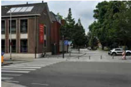
De ingang vanuit de stad naar de Spoorzone