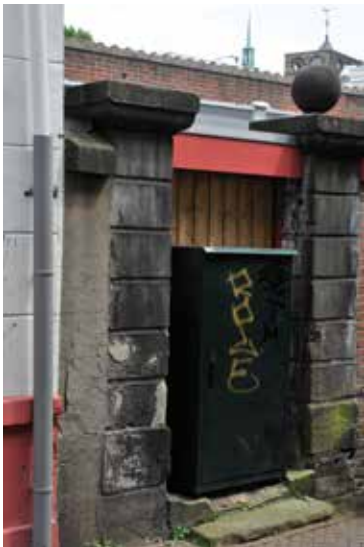
Het oude poortje in de Walstraat

Projectgroep Noorderhagen Om dezelfde reden is een projectgroep Noorderhagen in het leven geroepen. De groep concentreert zich op fysieke maatregelen om de Noorderhagen en omgeving een beter aanzien te geven. Ook hier is de wijkraad actief. In dit project zit veel geld uit de wijkbudgetten van 2012 en 2013. Een van de zichtbare resultaten is de nieuwe verlichting die ook op het Wilminkplein zal worden aangebracht.