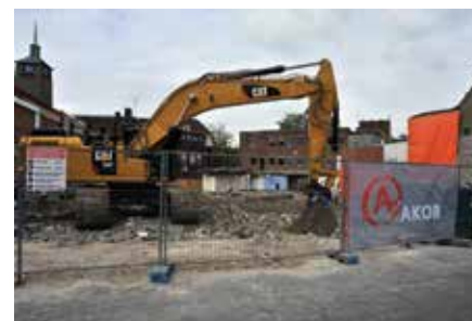
Sloop van de Hofpassage in 2016

Voor de Gemeente is het stadsdeelmanagement de spin in het web van