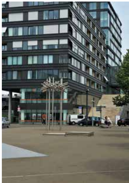
Woonvoorziening de Parallel

De plannenmakers en uitvoerders waren zich er zeer van bewust dat de woonfunctie van de binnenstad een zeer belangrijk element in die ontwikkeling was. Zonder bewoners zou veel van de dynamiek en leefbaarheid van de binnenstad verloren