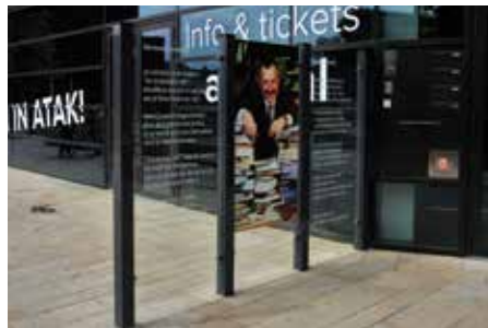
Poëzie op het Wilminkplein

DIEdichters Enschede en de SLME (Stichting Literaire manifestaties Enschede). Zij wilden op een of andere manier gedichten publiceren op het Wilminkplein om op die manier de naam van het plein meer eer aan te doen. De wijkraad is hier meteen op ingegaan omdat elke verlevendiging van het Wilminkplein in positieve zin zeer welkom was gezien de vele overlast die op het plein ondervonden werd. Vanaf dat moment is de wijkraad zeer actief geweest om het gestelde doel te bereiken want gemakkelijk ging dat niet. Na allerlei vruchteloze pogingen kwam in januari 2016 het project in een stroomversnelling en onlangs op 5 juni was er een officieel moment waarna de eerste gedichten te lezen waren.