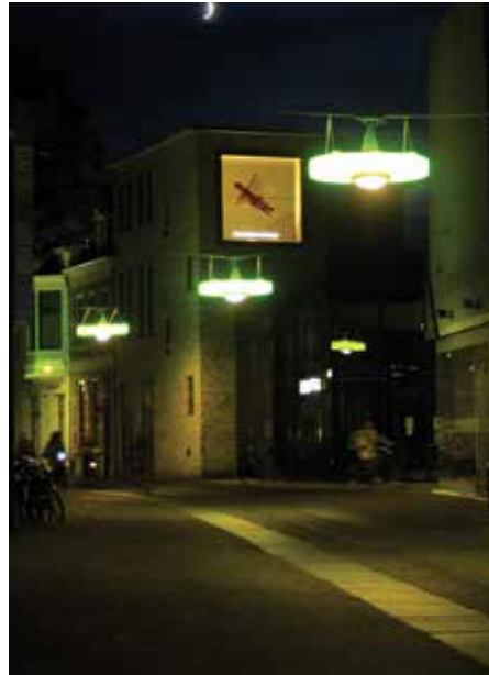
Noorderhagen by night